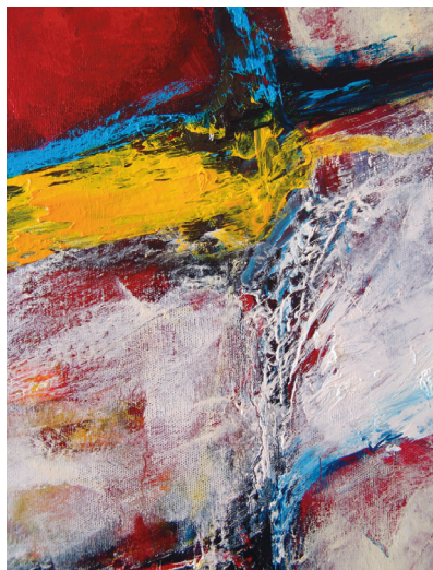
Ibrahim Coskun • „o.T.“, Öl auf Leinwand

Hermann Flint: 1982-87 Studium an der Hochschule der Künste in Bremen (Malerei, Drucktechnik und Film/Video) / 1992/93 Künstlerischer Mitarbeiter des Senators für Bildung, Wissenschaft, Kunst und Sport in Bremen / seitdem freiberuflich tätig als bildender Künstler in Berlin / 2002 Dozent für soziale und künstlerische Einrichtungen in Berlin. Werke in öffentlichen Sammlungen: Mannheimer Kunsthalle, Kurpfälzisches Museum Heidelberg, Kunsthalle Kiel, Theatermuseum Köln.