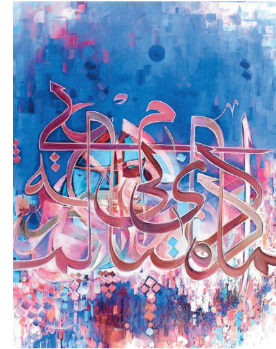
Munir Al-Ubaidi • „Eleganz 1“, Fotografie/Mischtechnik auf Papier, 50 x 33 cm, 2007

(Künstlername Karayilan = Schwarze Schlange) lebt und arbeitet als Lehrerin für klassischen orientalischen Tanz in Berlin.