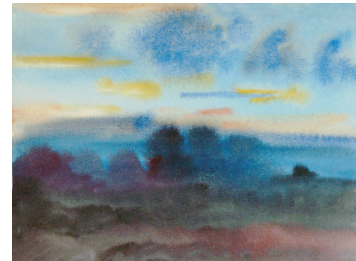
Yury Arefiev • „Nebel“, Aquarell auf Papier, 20 x 30 cm, 2007

Munir Al-Ubaidi: 1949 in Buhriz (Irak) geboren / 1970 Abschluss in Geschichte und Kunstgeschichte an der Universität Bagdad / seit 1969 Mitglied der Al-adab-Gruppe / lebt und arbeitet in Berlin.